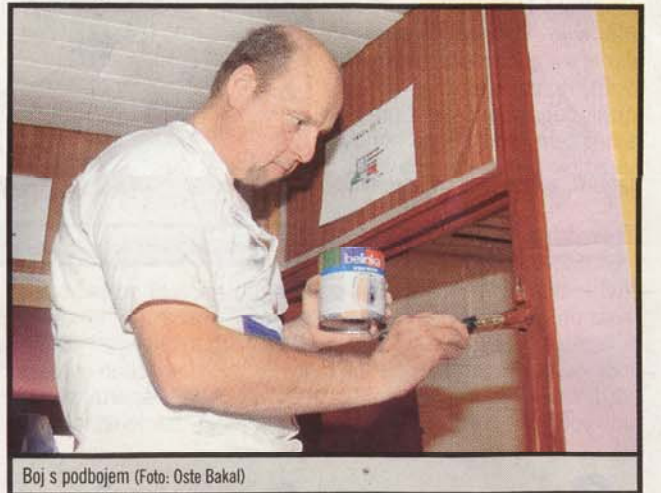
Boj s podbojem