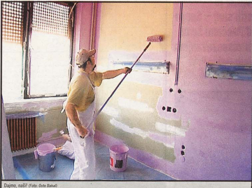
Dajmo, naši!

P red dnevi so se slovenski slikopleskarji, člani območnih obrtnih zbornic, že osmič pomerili na državnem tekmovanju, tokrat v prostorih Splošne bolnišnice Murska Sobota. Tekmovalci in humanitarne ekipe so uredili prostore internega oddelka v 1. nadstropju, specialistične internistične ambulante internega oddelka, hodnike 2. nadstropja kirurškega oddelka ter vsa vrata in podboje 1. nadstropja ginekološko-porodniškega oddelka. Tako je imela akcija poleg tekmovalnega tudi humanitarni pomen, saj so pokrovitelji zagotovili material in orodje, tekmovalci in humanitarne ekipe pa so delo opravili brezplačno. Prireditvev so organizirali Območna obrtna zbornica Ptuj, pomurske območne obrtne zbornice Murska Sobota, Lendava, Gornja Radgona in Ljutomer ter Obrtna zbornica Slovenije. Po ocenah pozna-