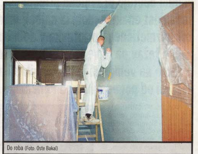
Do roba