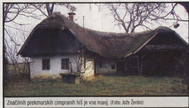
Značilnih prekmurskih cimpranih hiš je vse manj.

petrolejkami ali svečami, ni bilo vodovoda, ob hišah pa je bil le vodnjak, iz katerega so ročno zajemalo vodo za ljudi in živino. Tudi pri Petkovičih so imeli krave, poleti pa je bila na domačem dvorišču še mlatilnica, s katero so mlatili pšenico in rž. (J. Ž.)